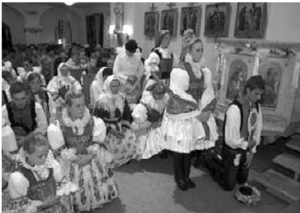
Slavnostní mše svatá.

(mnoho dalších fotek najdete na www.slovackoDNES.cz )