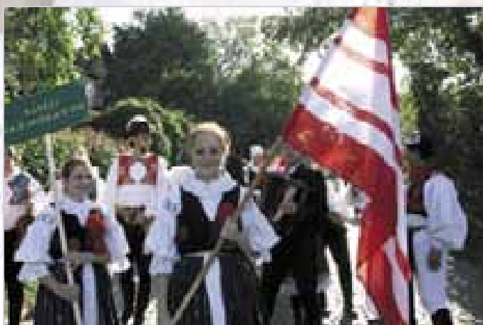
Veselí nad Moravou