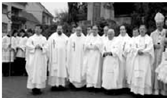
Arcibiskup s přítomnými kněžími.

„Po řadě rozčilených výstupů (někteří chtěli svoje pozemky příliš zpeněžit a peníze hned požadovali) bylo usneseno vykoupit pozemky na Padělcích,” poznamenal si P. Man. Skoro bych dopsal, pokud jde o pozemky a sjednání ceny, život ve Lhotě se ani po sto letech nezměnil. Konečně je ale kostel hotový! Ještě před jeho oficiálním „otevřením” píše P. Man do listiny, která je uložena ve věži kostela: „Ať budova tato šťastně se dokoná, ať hlásá slávu Jeho po všem okolí, ať mluví o obětavosti a lásce příštím potomkům, kteří toto čísti budou, jaké námahy a starosti bylo podniknout těm, kteří pro chrám tento pracovali.”