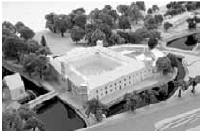
Fotografie modelu architektonického řešení zámku.

Snažili jsme se zjistit, kdo stojí za rekonstrukcí zámku - tady jsou zcela aktuální informace