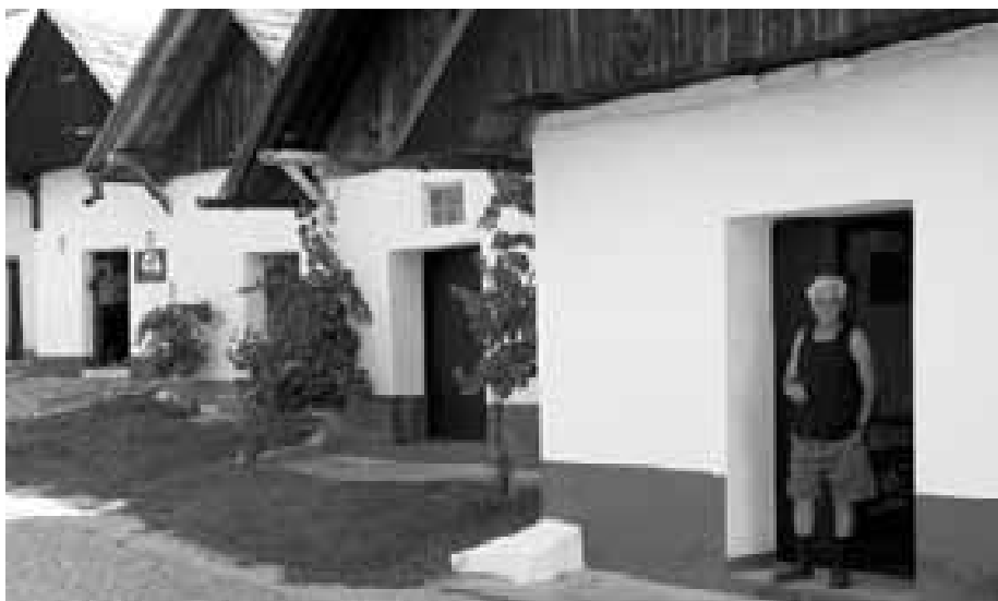
Blatničtí vinaři vyhlízejí návštěvníky, ten vpravo je pan Miroslav Bachan. Akce Z budy do budy byla určitě dobrým nápadem, bohužel se setkala s malým zájmem lidí.

se chce obléci do kroje. Po poledni je totiž připraven mezi sklepy kulturní program, ve kterém vystoupí mimo jiné mužský sbor, jehož je členem.