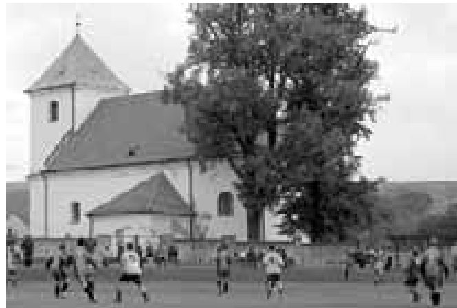
Na Nové Lhotě.

„Všechno je to založené na silných ročnících. Před pár lety jsme měli tak silný a šikovný ročník, že naši muži hráli i okresní přebor. My nemáme peníze na to, abychom kúpovali po okolí nějaké hráče, takže hrajeme s tím, co máme. U žáků je to ještě horší. Šikovní