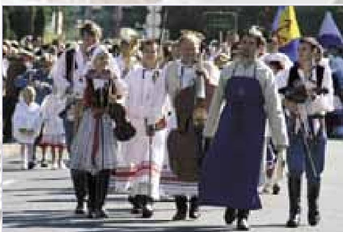
Hosté z Horňácka