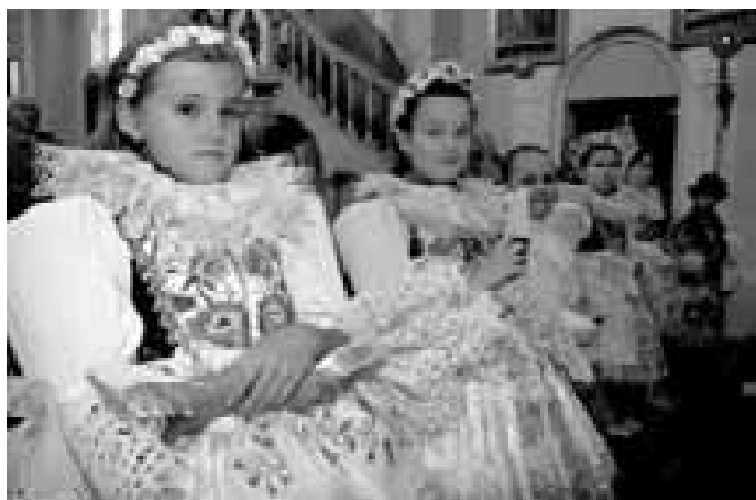
Lhotské děti v krojích.