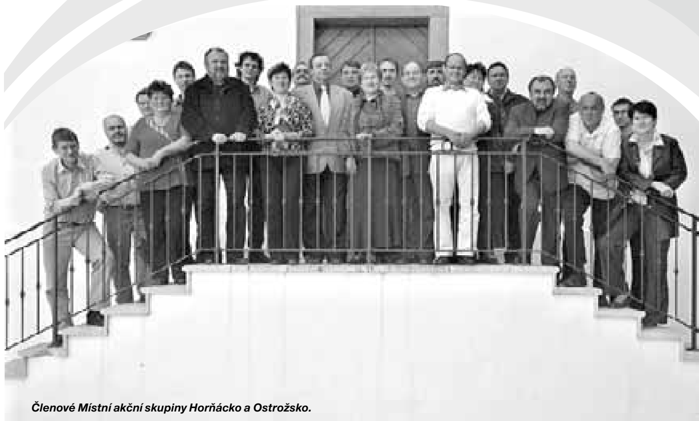
Členové Místní akční skupiny Hornácko a Ostrožsko.