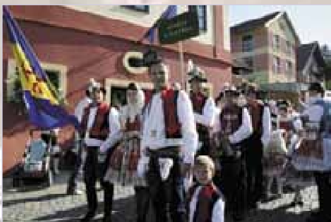
Boršice u Blatnice