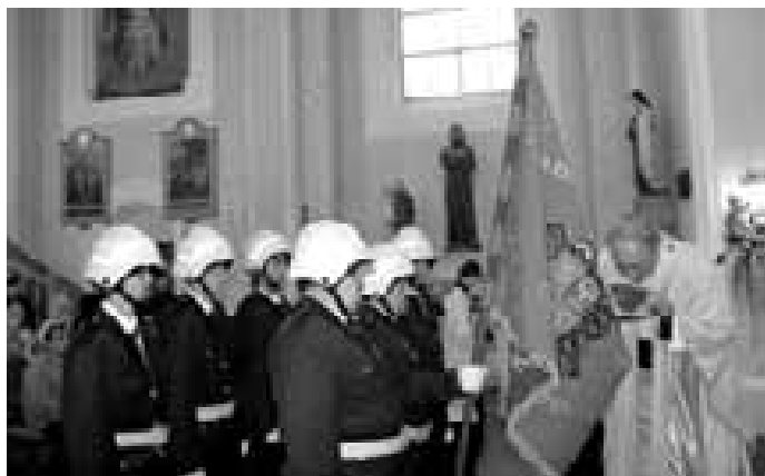
Žehnání praporu lhotských hasičů.