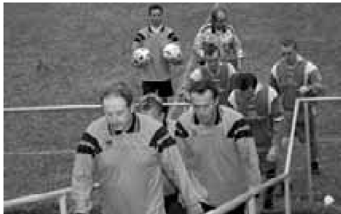
Hráči Suchova a Tasova odcházejí do kabin.