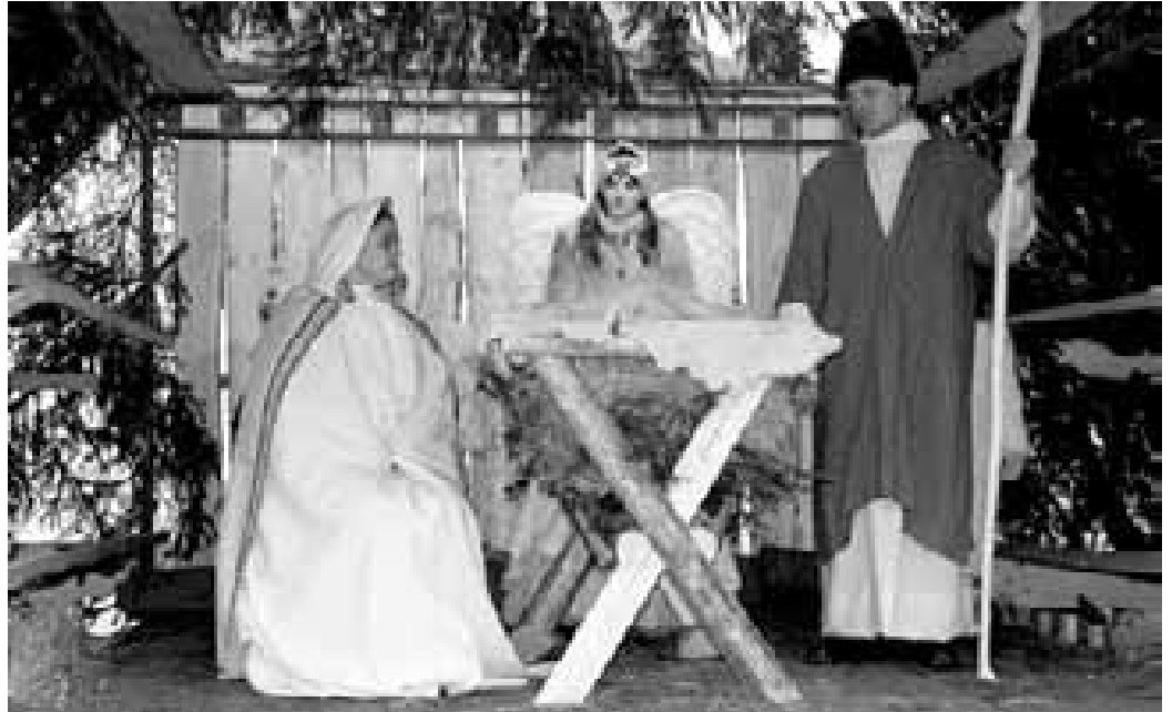
Vzpomínka na Živý Betlém, Ostrožská Nová Ves 2007