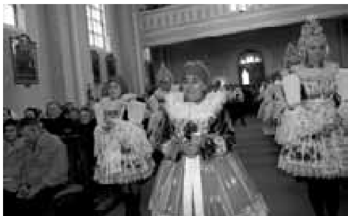
Jedna z žen, oceněná za práci pro farnost.