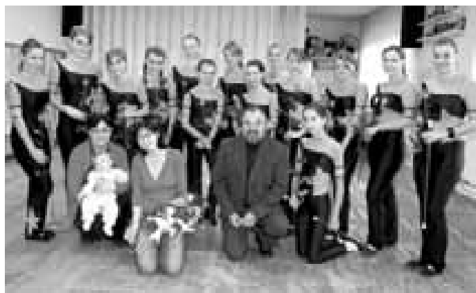
S hluckým starostou, v popředí vedoucí mažorettek.

(více informací i videozáznam z obou vystoupení najdete na www.slovackoDNES.cz )