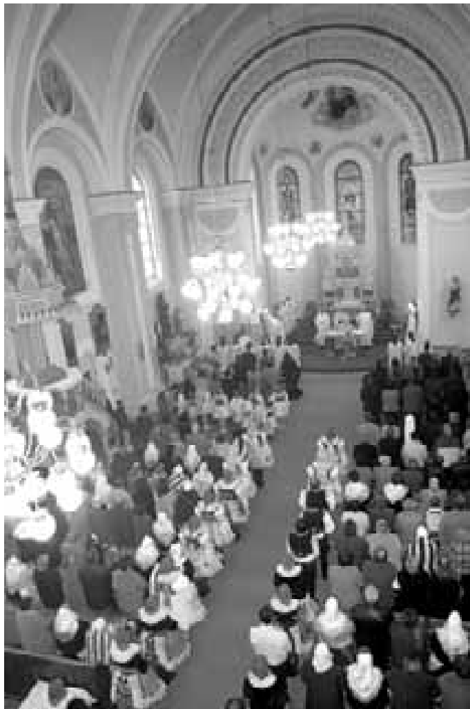
Kostel sv. Jakuba st. přesně 100 let po svém posvěcení.

Vidíte ho už z dálky, pojedete-li od Hluku, odbočíte do vesnice, sjedete z kopce dolů a pak se začnete šplhat nahoru. A právě v kopci stojí a táhne se do pořádné výšky. Kolem je škola, pomníky obětem