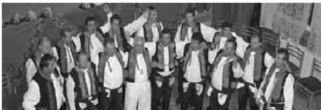
Když se letos v lednu sešli poprvé, nebylo jisté, že sbor skutečně vznikne.