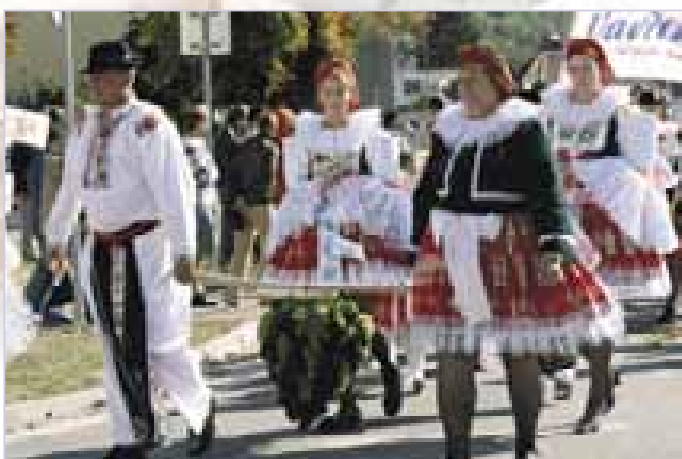
Blatnice pod Svatým Antonínkem