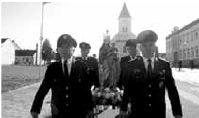
Hasiči nesou sochu Panny Marie z kostela do zvonice