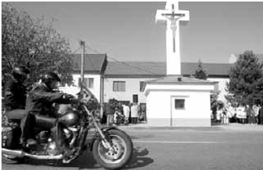
Žehnání obnovené zvonice, Ostrožská Nová Ves, 5. říjen 2008

Vsadím se, že málokterá zvonice je tak „slavná“, jako zvonice stojící těsně u frekventované silnice v Ostrožské Nové Vsi - kde ji loni zbořil při autonehodě kamion. Jak jsem se několikrát přesvědčil, známá a svým způsobem i slavná je, málokdo však o ní ví něco bližšího.