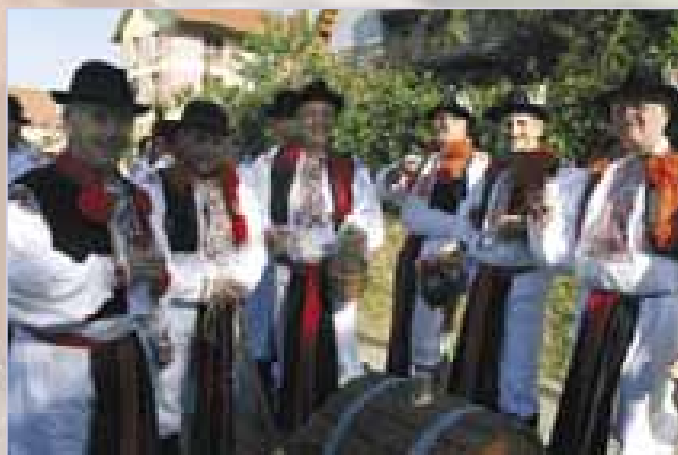
Ostrožská Nová Ves