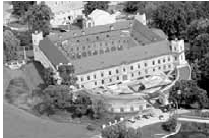
Vizualizace - zakres studie obnovy zámku do letecké fotografie.

Autor: Petr Krejčík - Studio Anarchitekt