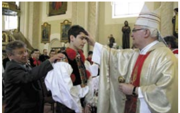
Ostrožská Lhota 2008, biřmování.