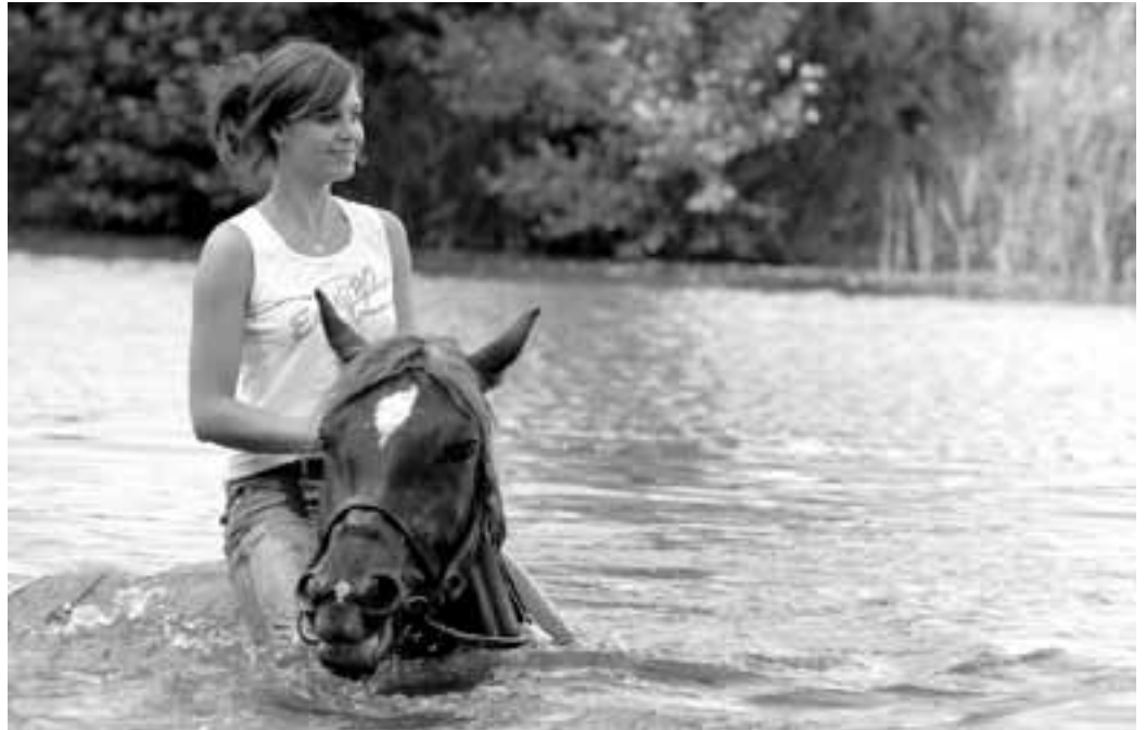
Léto na Slovácku.