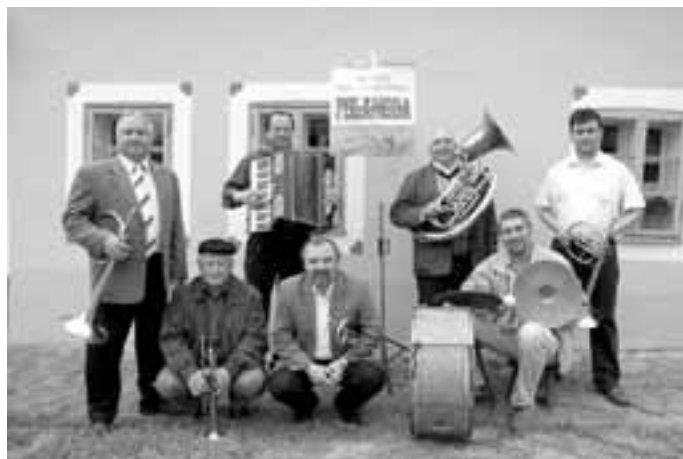
Polahoda před památkovým domem v Hluku.

9. Všechny výjimky mohou být uděleny jen se svolením otce zakladatele.