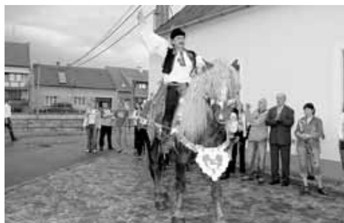
A tady už sedí na koni. Přes všechny potíže se nakonec jízda vydařila. Tradice žije! Otázka, jak dlouho.