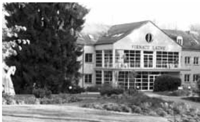
Hlavní budova lázní, které dnes mají několik majitelů - obec a několik jednotlivců, kteří mají kořeny ve Vičnově.

(V dalších číslech časopisu vás seznámíme s lékaři i procedurami, které nemocným lidem pomáhají)