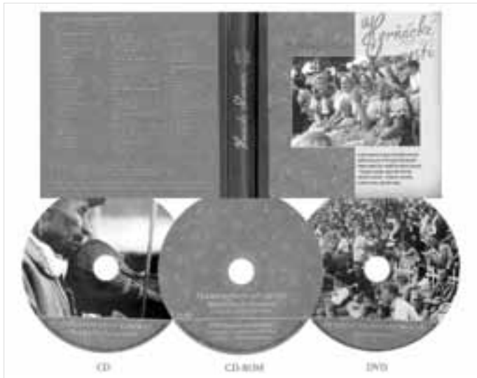
Obal a jednotlivé disky unikátního almanachu.

Lidé můžou získat unikátní multimediální almanach, který poskytuje zatím nejucelenější pohled na přehlídku horňáckého folkloru