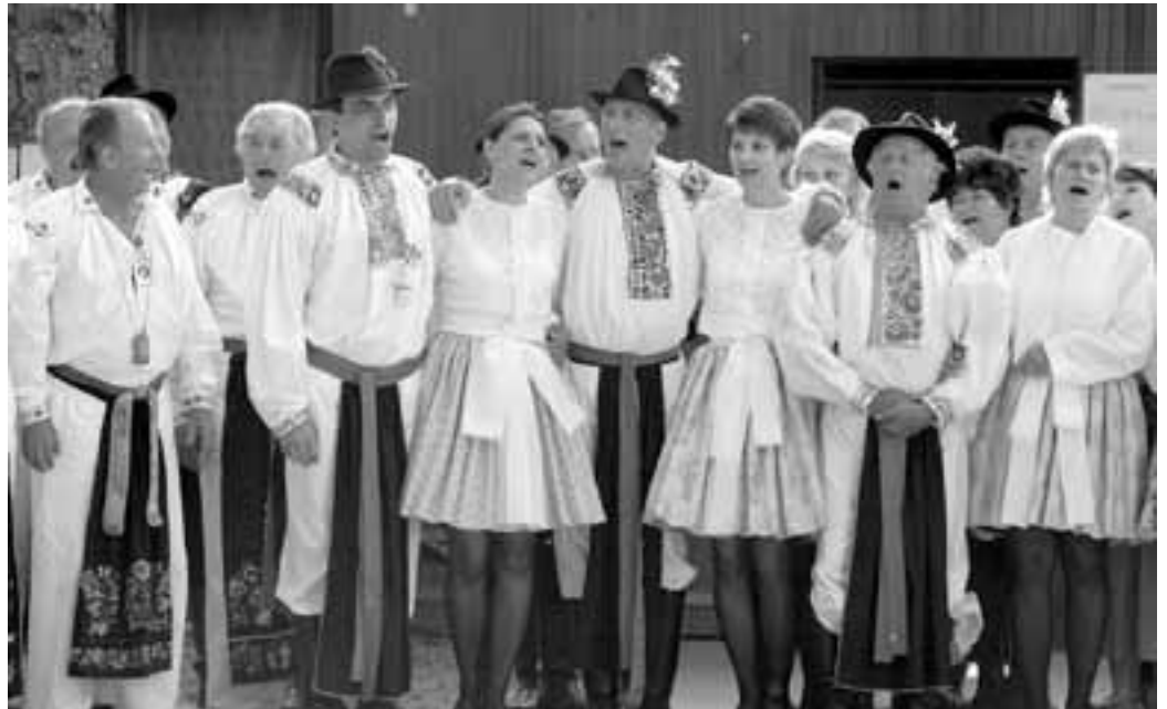
Lázně mají krásný park, ve kterém je možné navštívit stále více kulturních akcí. V červnu tady například zpívaly mužské a ženské sbory, ten na snímku je domácí z Ostrožské Nové Vsi. FOTO: RB

Sulfan dokáže ve spojení se špičkovou lékařskou péčí zázraky, což by mohli potvrdit především