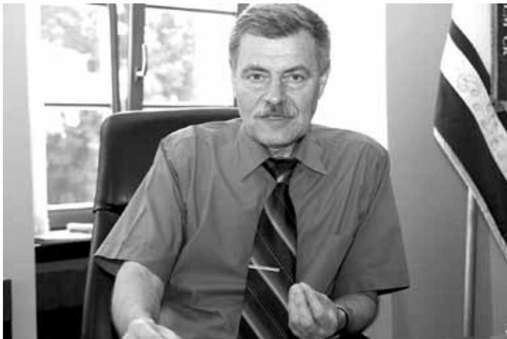
Kritika ano, ale musí být věcná. Staronový, sociálně demokratický, starosta Veselí nad Moravou.

V některých místech Veselí skutečně vypadá nehostinně, zejména centrum je nepěkné, okolí kulturního domu je vlastně surový terén. Tam nás ještě čeká hodně práce. Když říkám nehostinně,