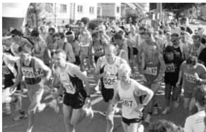
Aktivní Horňácko přineslo do Malé Vrbky závod o Malansků trnku.