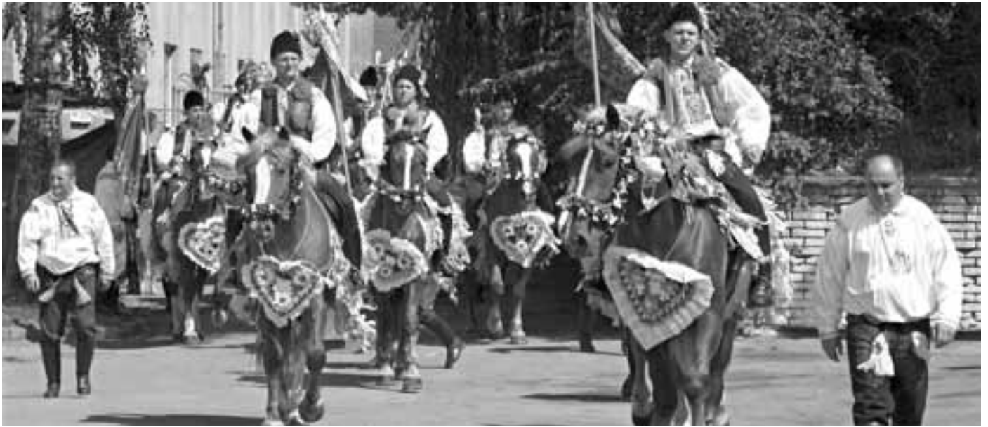
Slavná hlucká jízda králů právě vjíždí na stadion. Za chvíli se všech dvacet osm jezdců na koních seřadí vedle sebe. Vznikne ojedinělý obraz, na který mnozí nezapomeneme celý život.