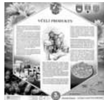
Pohled na část tabule, kterou najdete na unikátní včelařské stezce

Třeba naučnou včelařskou cestu, krásný nápad. Táhne se podél cyklostezky mezi Kunovicemi a Ostrožskou Novou Vsí. Na několika místech dřevěné panely, kde se dozvíte mnohé o včelách. Celý jejich život ve zkratce, poutavě vyprávění, které vám dá pocítit, jak úžasná je příroda. Nebo knížka Františka Nešpora, která vyšla teprve před několika týdny a jmenuje se Včelí království. „Ze včelaření jsem se naučil přírodu znát a více ji milovat než z mnoha knih učených,“ zní motto celé