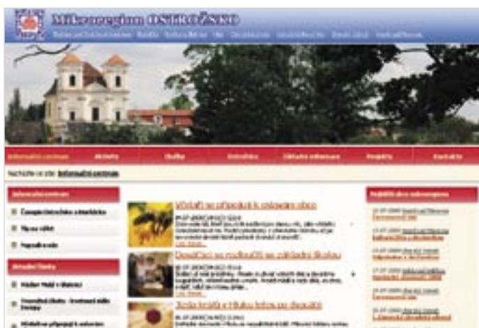
Tak vypadají naše nové internetové stránky - www.ostrozscko.cz