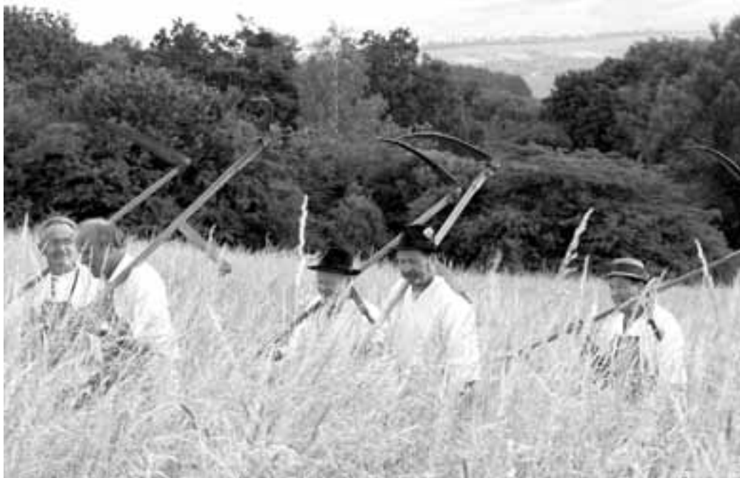
Paradox dnešní doby. Kosy sice nahradily motorové sekačky, ale obliba organizovaného folklorního setkávání s kosou a písničkou roste. Horňácko, louky nad Malou Vrbkou, červen 2008.

Reportáž z místa, kde ještě můžete najít klid