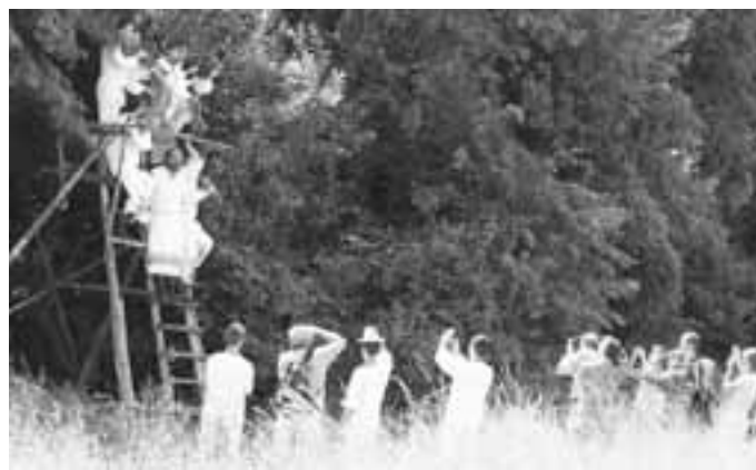
„Civilizace“ dorazila i do horňáckých kopců, byť ještě ne v tak velké síle. Počet fotografů zatím nepřevyšuje počet zpívajících.

Nováčci můžou být překvapeni nebo dokonce zaskočení. Na místě je nečeká žádné malé políčko, ale pořádně rozlehlá louka.