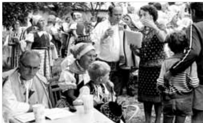
Zákulisí Horňáckých slavností 1982

Čtenář, posluchač a divák dostává do rukou dokument podávající mu