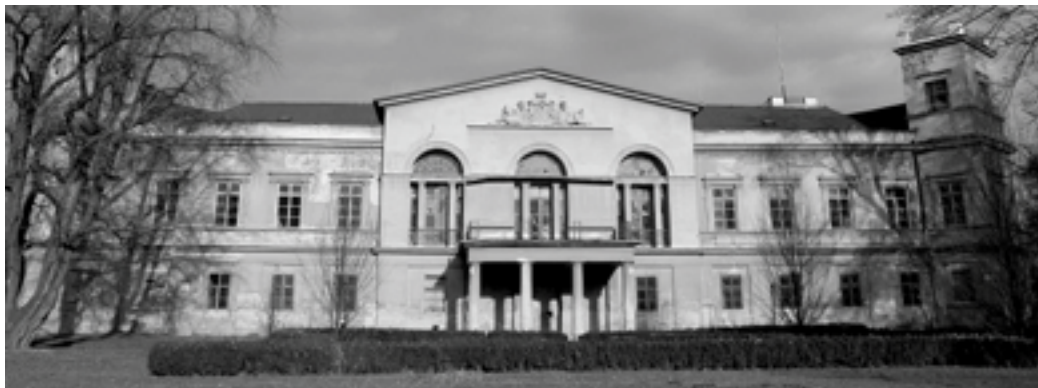
Budoucnost zámku ve Veselí nad Moravou je stále nejistá, rok 2008 možná napoví více.

Dovolte mi začít poněkud osobně. Letos v létě jsem si sám pro sebe objevil v našem regionu jedno místo, které má v sobě ukryto velké kouzlo. Tím místem je park u zámku ve Veselí nad Moravou a celé široké okolí. Bude nesmírně důležité, jakou podobu tomuto prostoru nakonec dají zástupci města společně se soukromými majiteli nemovitostí i pozemků, a samozřejmě také s architekty. Protože je v tomto klíčová budoucnost zchátralého zámku, podíval jsem se, co se kolem něho v posledních letech vlastně dělo.