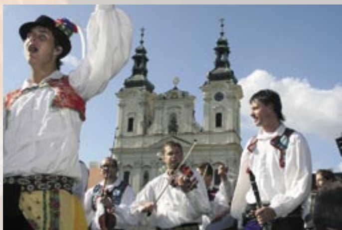
Veselí nad Moravou