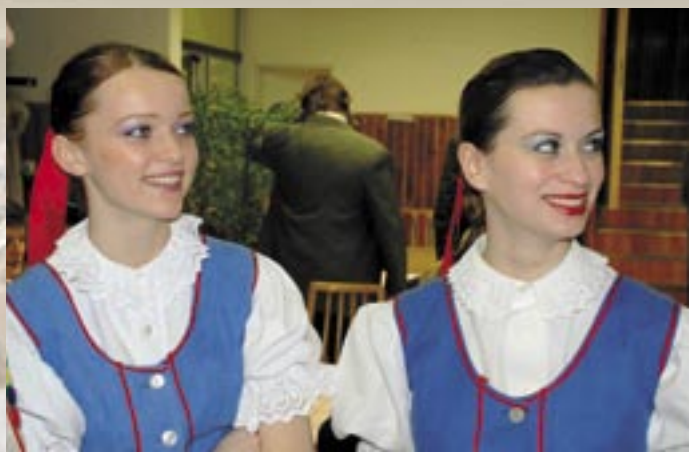
Blatnička (návštěva ze Slovenska)