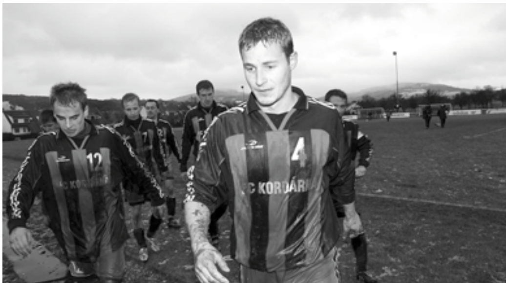
Hráči Velké odcházejí zablácení a unaveni po utkání, v němž vydřeli těsné vítězství.

Možná právě tato scéna nejlépe ukazuje, jaké fotbalové nadšení ve Velké nad Veličkou panuje. Nikdo si nedovedl představit, že