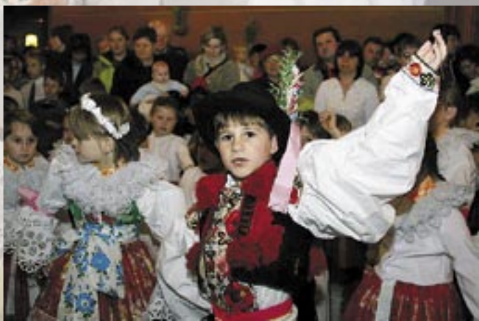
Blatnice pod Sv. Antonínkem