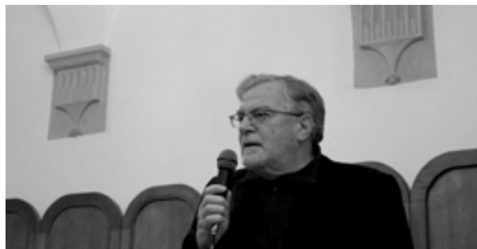
Známý herec mluvil také o účinkování v seriálu na Primě