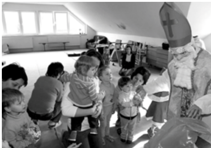
Evropské peníze můžou získat i jednotlivci nebo neziskové organizace. Jako například maminky z Mateřského centra Domeček z Ostrožské Lhoty, které shánějí peníze na dětské hřiště.

Vždyť právě náš region je zřejmě posledním místem, kde lidové tradice žijí, kde ještě lidem něco