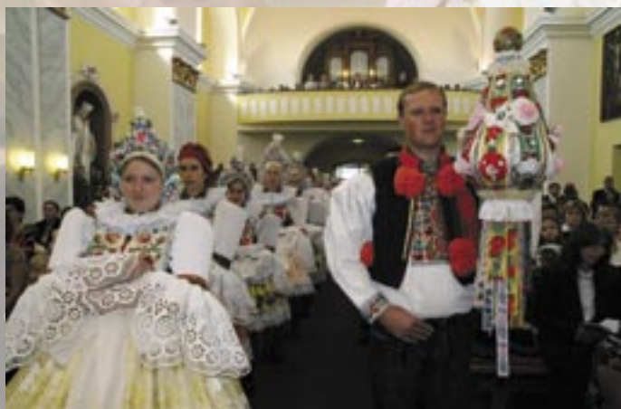
Ostrožská Nová Ves