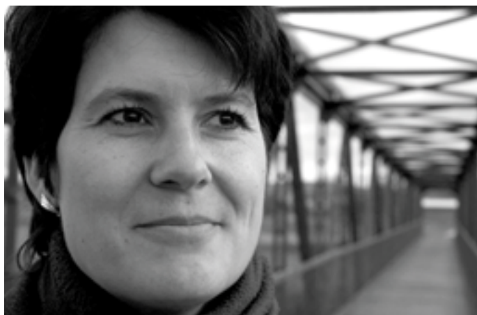
„Rozdělování peněz z EU je zbytečně komplikované.“