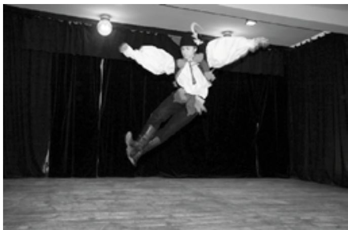
Horňácko a Ostrožsko se snaží také o získání peněz na záchranu a rozvoj lidové kultury. Ohrožený je například slovácký tanec verbuňk, který je přítom na seznamu světového dědictví UNESCO.

Pokud se ales takovým označením smíříme a „prodereme“ se dál, zjistíme, že bychom měli zbystřit svou pozornost. Nejde tady totiž o nic menšího, než o spolupráci v rámci celého regionu, a také o velké peníze, které bude za určitých okolností rozdávat v našem regionu ona akční skupina. Mnohem lepší název by proto zněl například – nadace pro venkov.