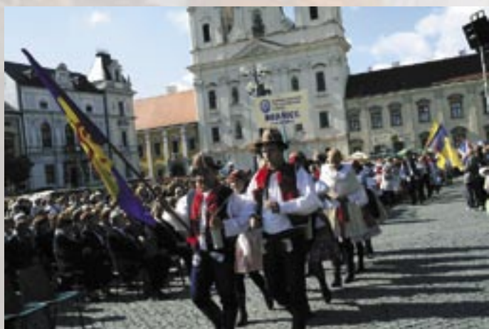
Boršice u Blatnice