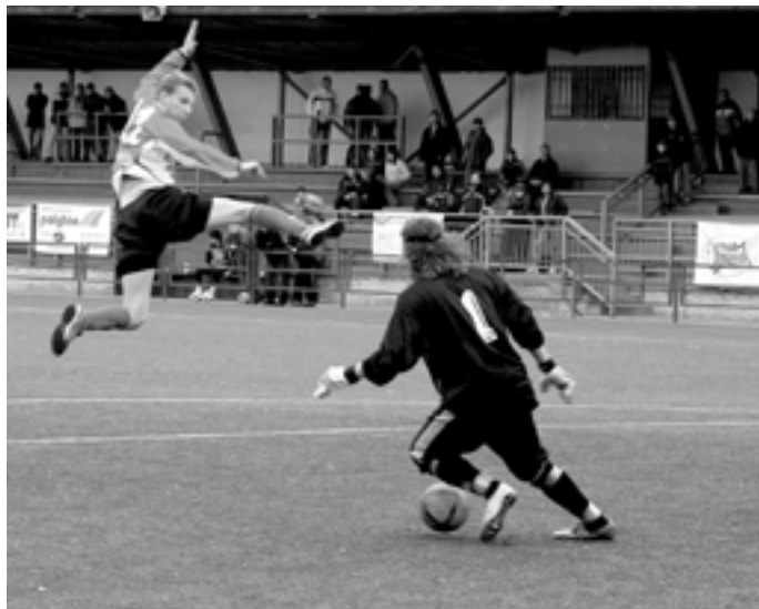
I takový zajímavý obrázek byl vidět v přípravném utkání Hluku s Uherským Brodem.