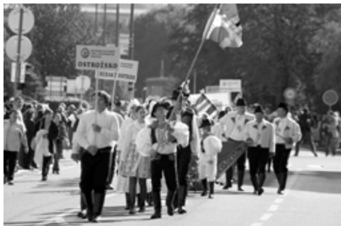
Starosta v čele slavnostního průvodu Mikroregionu Ostrožsko na Slavnostech vína v Uherském Hradišti.

My s nimi chceme spolupracovat. Nechceme jim ale nic vnucovat, nechceme nic vnucovat tamním obcím ani Mikroregionu Horňácko, ať si Horňáci své specifikum zachovávají, to je určitě velmi důležité. Ale když se podíváte