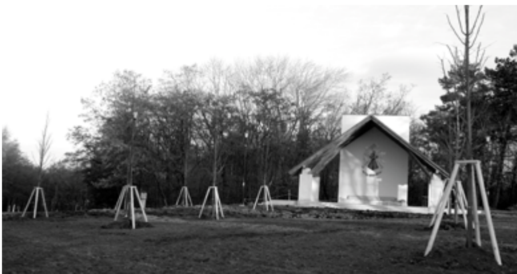
Současný pohled na nový liturgický prostor na sv. Antonínku