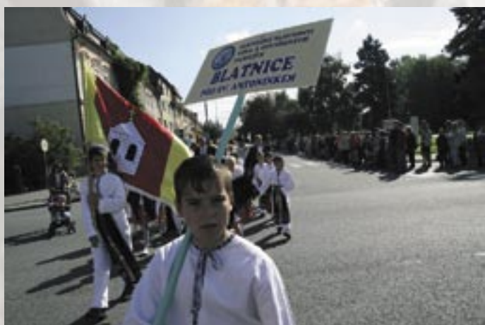
Blatnice pod Sv. Antonínkem