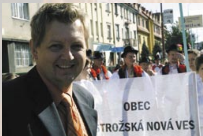
Ostrožská Nová Ves