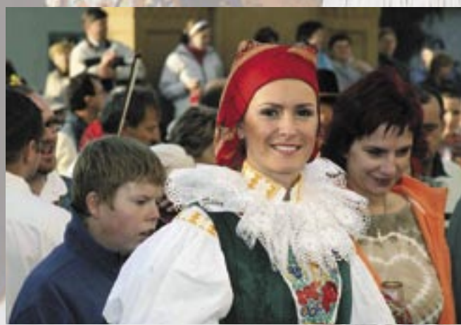
Veselí nad Moravou