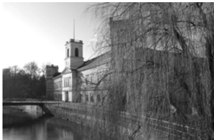
Zámek ve Veselí nad Moravou má nadále své kouzlo. Celé okolí působí velmi zajímavě, park u zámku je velmi dobře udržovaný. Nikdo ale neví, co přinese budoucnost.