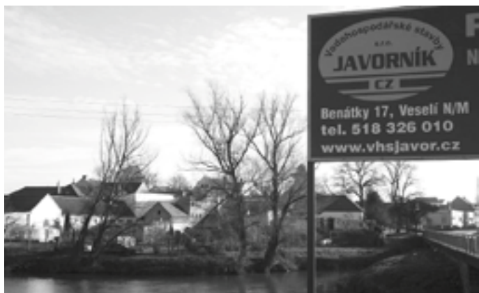
Firma Javorník – cz má sídlo ve Veselí nad Moravou, ale její záběr je velmi široký, sahá od Slovácka po Prahu