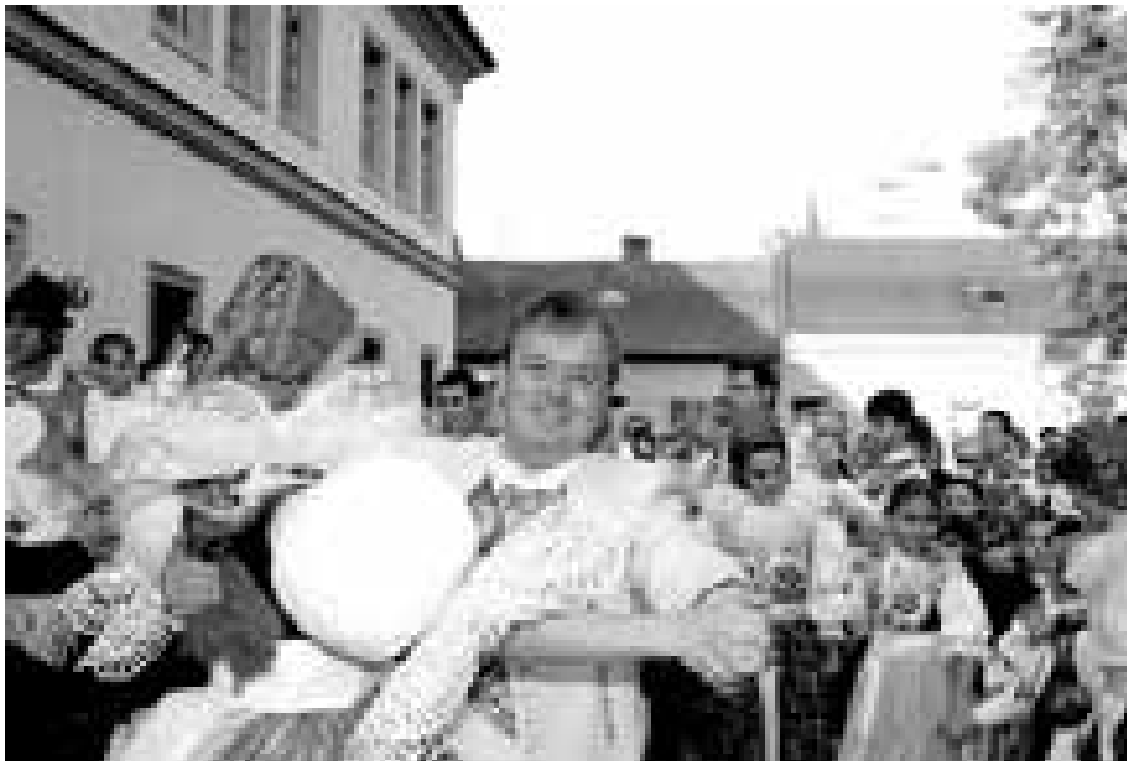
„Nemyslím, že Veselané jsou nekulturní.“