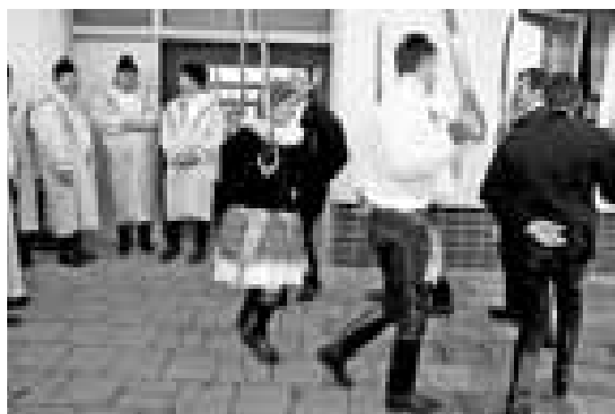
Tradice netradice, v Hluku (dolní snímek) i v Ostrožské Nové Vsi tančily v jednu chvíli šavlový tanec i dívky. Všude jinde, kde se tento tanec tančí, věc nevidaná.