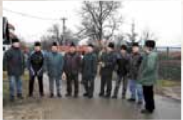
Blatnice pod Sv. Antonínkem