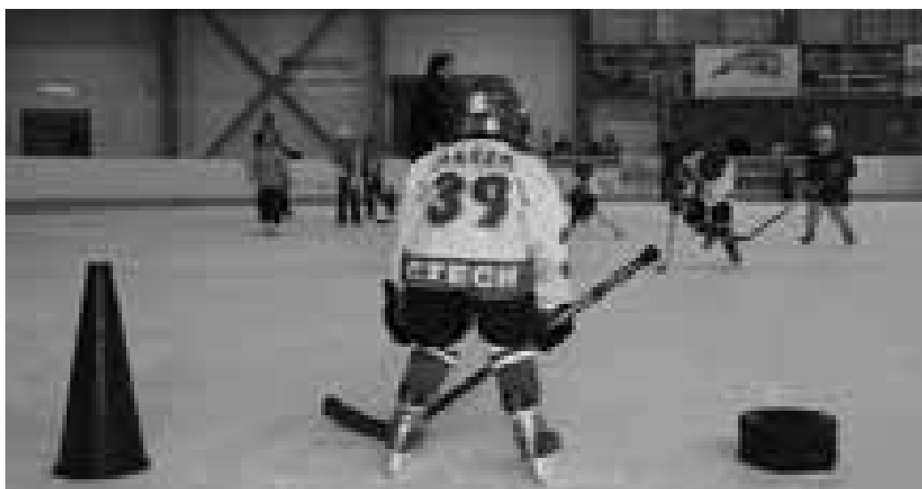
I v Uherském Ostrohu může začít s hokejem nový Hašek nebo Jágr.