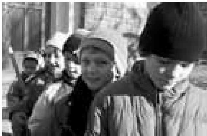
Mají zachránit dávnou tradici, ale jsou ještě malí.