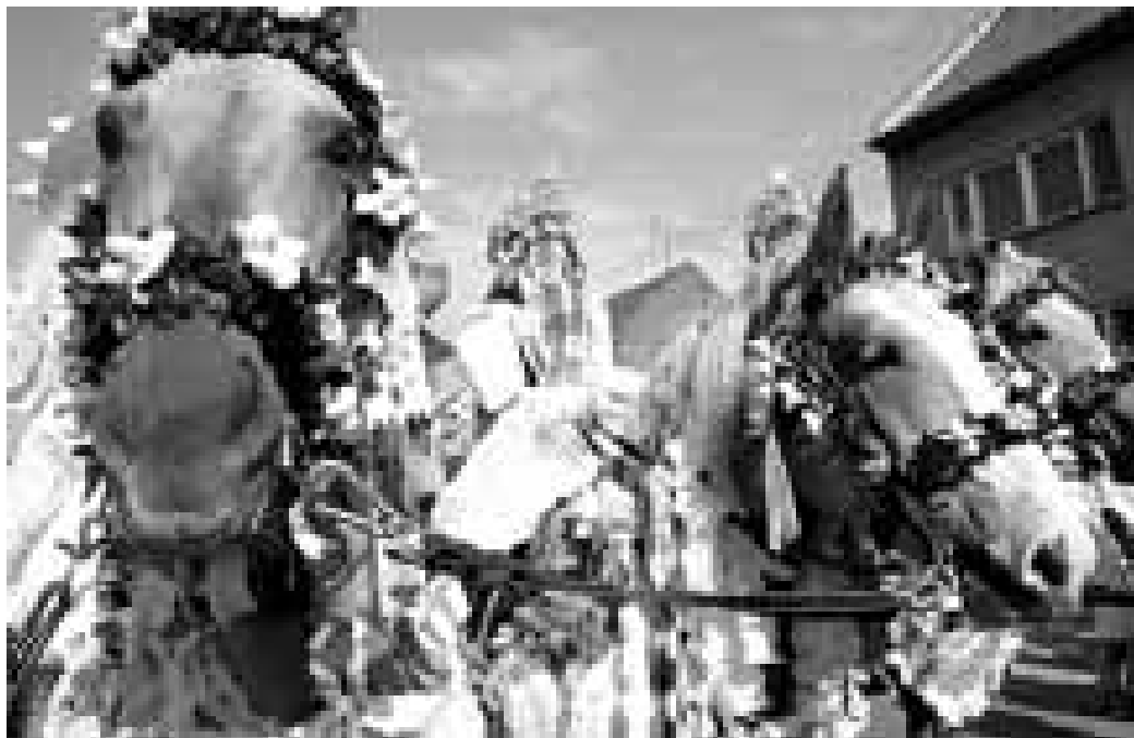
Hlucský král 2005.

V červenci se uskuteční jubilejní XX. Dolňácké slavnosti s jízdou králů