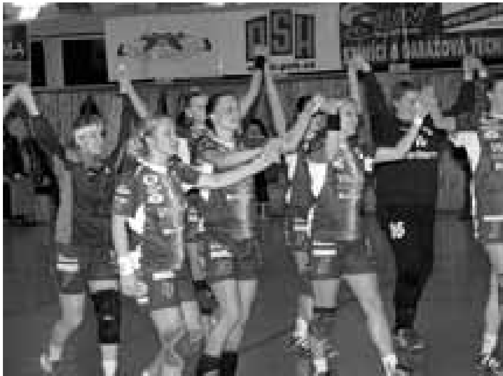
Chtějí patřit mezi nejlepší. I když hrají za malé město.