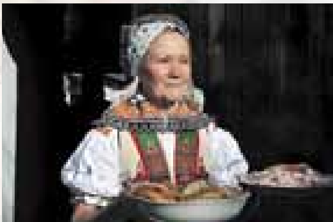
Velká nad Veličkou