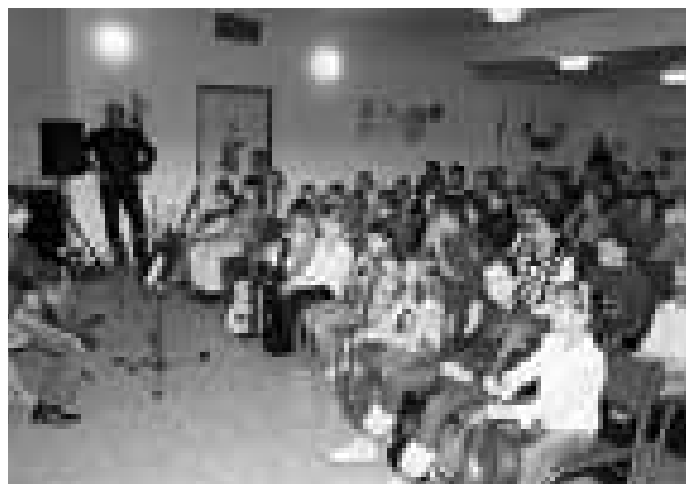
Ředitel naslouchá svým žákům.

Pane řediteli, děkuji vám za rozhovor a držím vám palce.