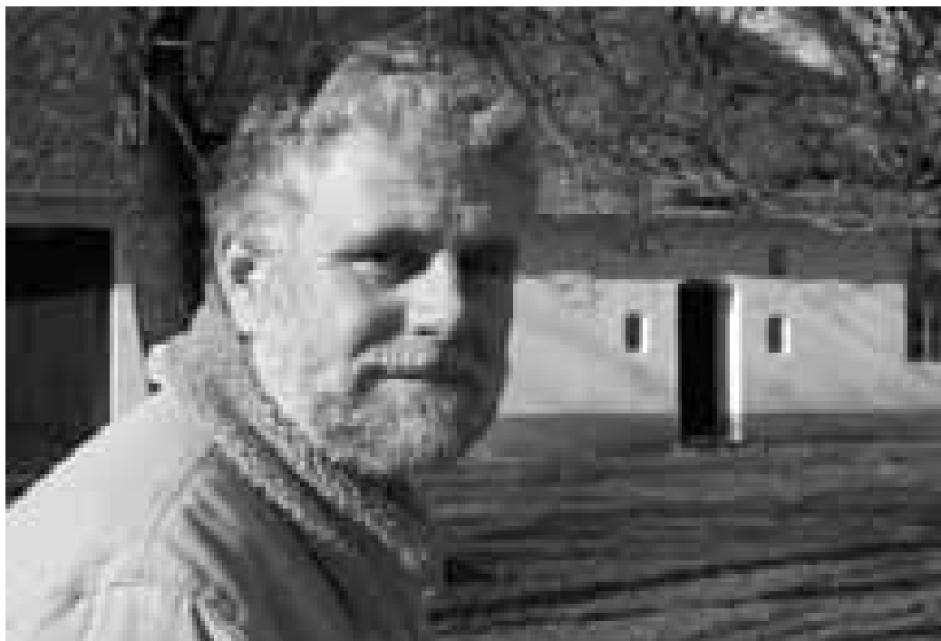
Dělá pro Horňácko víc než mnozí jiní. Takřka zadarmo.

norár, kerý vůbec nestačí pokryt našu aktivnú činnost. Nedějuám to proto, abych na tom vydějuau, byu suavný. Myslím, že k téj suávě su suavný už dost, ale tvorím to kvůli tomu, že chcu náš kraj v dobrém slova smyslu především propagovat. Nekeří páni úřednici tvrdijú, že to někde není treba, ale já su pevně presvědčený, že je. A navíc po naší práci to ostává