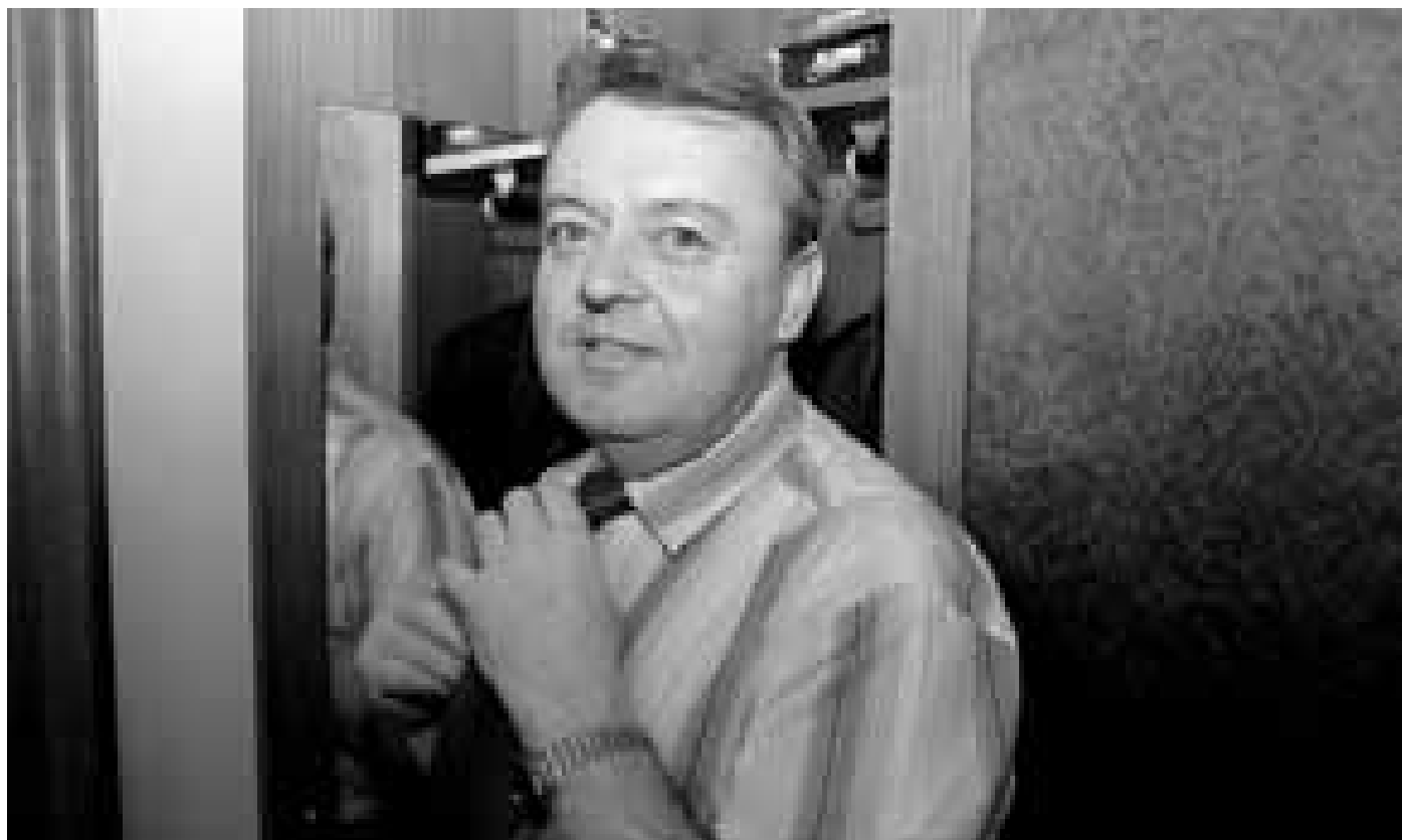
„Jsme nuceni šetřit, máme dluhy,“ tvrdí v rozhovoru starosta Veselí nad Moravou.

Dalším zajímavým místem je zámek, dnes velmi zdevastovaný, který město prodalo v dražbě za jeden milion korun. Do jaké míry věříte slovům