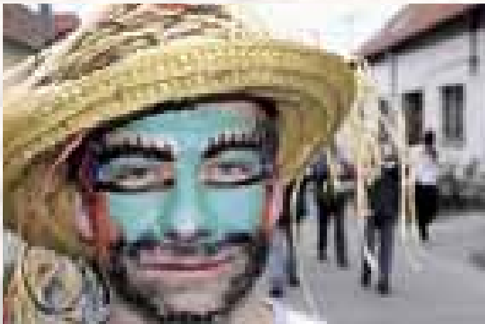
Ostrožská Nová Ves