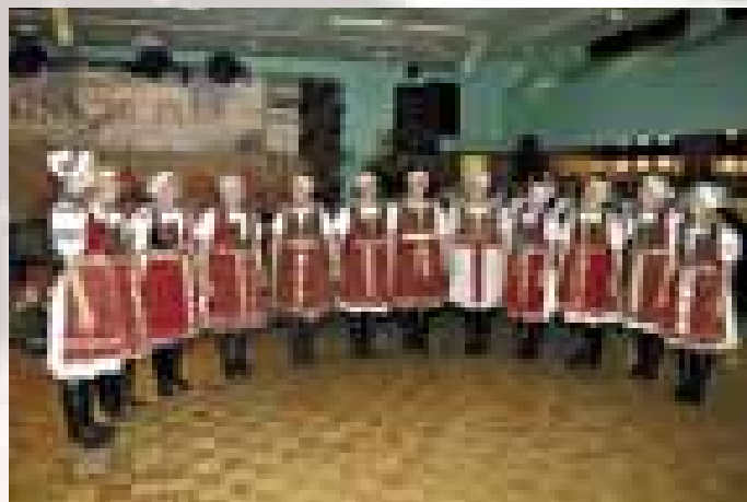
Ženský sbor z Javorníku, který také na CD zpívá