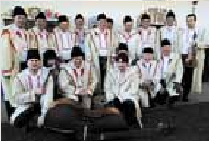
Hluk, mužský sbor