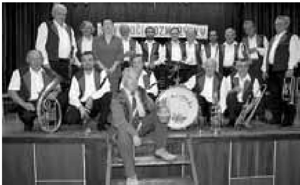
Poslední fotka kapelníka s „jeho“ Rozmarýnkou. Listopad 2007.