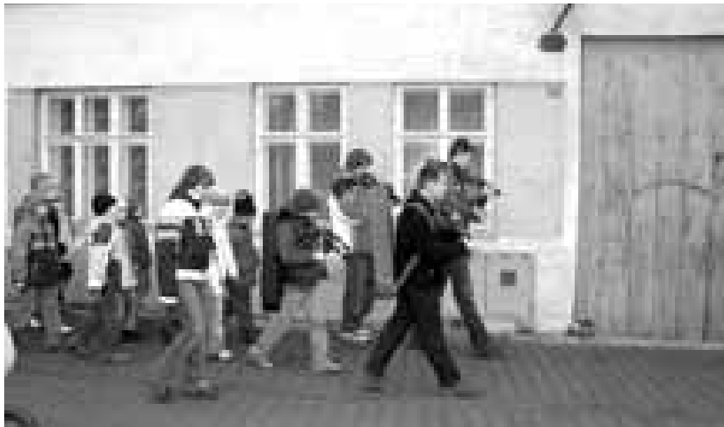
Je jich zatím málo, ale snad se jim podaří fašank do Blatnice pod Sv. Antonínkem přinést.