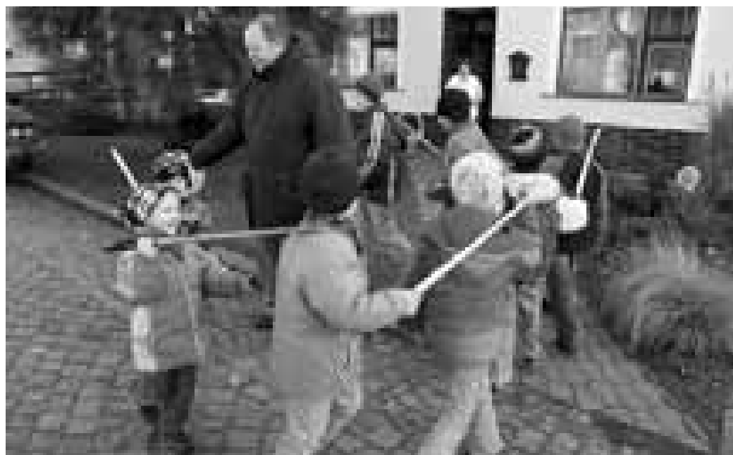
Nebýt toho velkého, tradice Blažejáků by letos zřejmě skončila.

dědeček, je to opravdu velmi dávná tradice. Nejzajímavější je, že když jsem zjišťoval, jestli ještě někde existuje, tak jsem na ní nikde nenarazil. Jsme asi jedini,“ sděluje výsledky svého pátrání. Možná už brzy ale „padne“ také