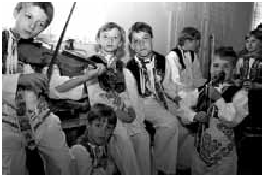
Zatím se učí, ale jednou z nich možná budou velcí muzikanti nebo zpěváci.

Bohužel. Kapacita je sto dvacet dětí a není síla, která by nám umožnila mít jich více. Je to