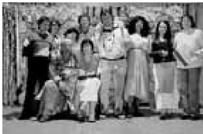
Ochotníci z Lipova pózuji při jedné ze zkoušek před premiérou představení Dívčí válka .

V červnu jeho četa upadla do rukou nepřátelských vojsk. V roce 1943 se dostal do výcvikového střediska Československé armády v Anglii a v roce 1944 se účastnil velmi známého vylodění spojenců v Normandii ve Francii.