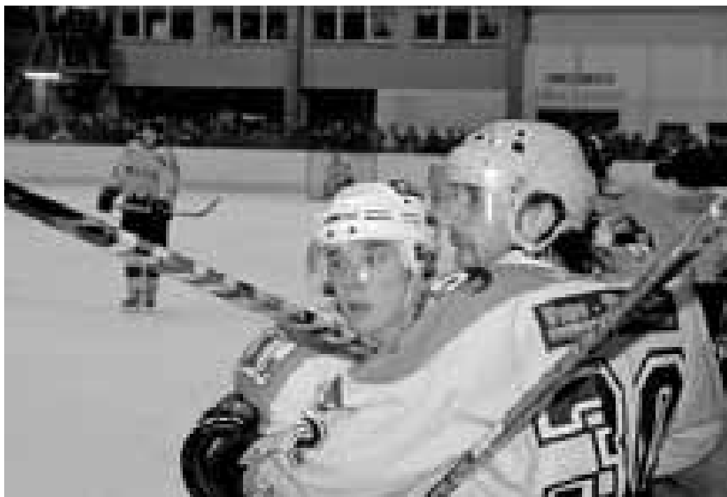
První mužstvo mělo solidní výsledky a přitáhlo na stadion řadu diváků.

Teprve čas ukáže, kteří z dnešních mladičkových hokejistů se nakonec postaví na brusle mezi ty nejlepší. Pokud ale hledají sportovní vzory, můžou je najít přímo na ostrožském stadionu mezi hráči prvního mužstva. Těm se sezóna docela vydařila, o čem svědčí množství diváků na utkáních. Stačilo například navštívit Ostroh v poslední době, když Uherský Ostroh hrál v únoru s Uherským Hradištěm play off o přeborníka Zlínského kraje. A stejná situ-