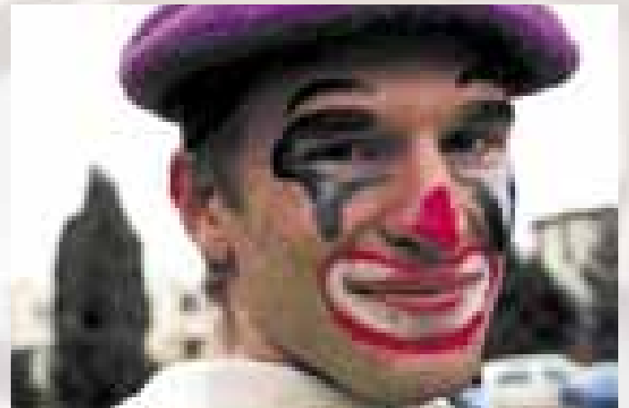
Ostrožská Nová Ves