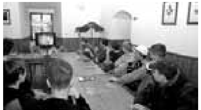
Jízda králů prý patřila k nejpyšnějším touhám hluckých šohajů, dozívají se dnešní kluci právě z videokazety.

několikrát jízdu králů absolvoval jako jezdec,“ píše ve své knize