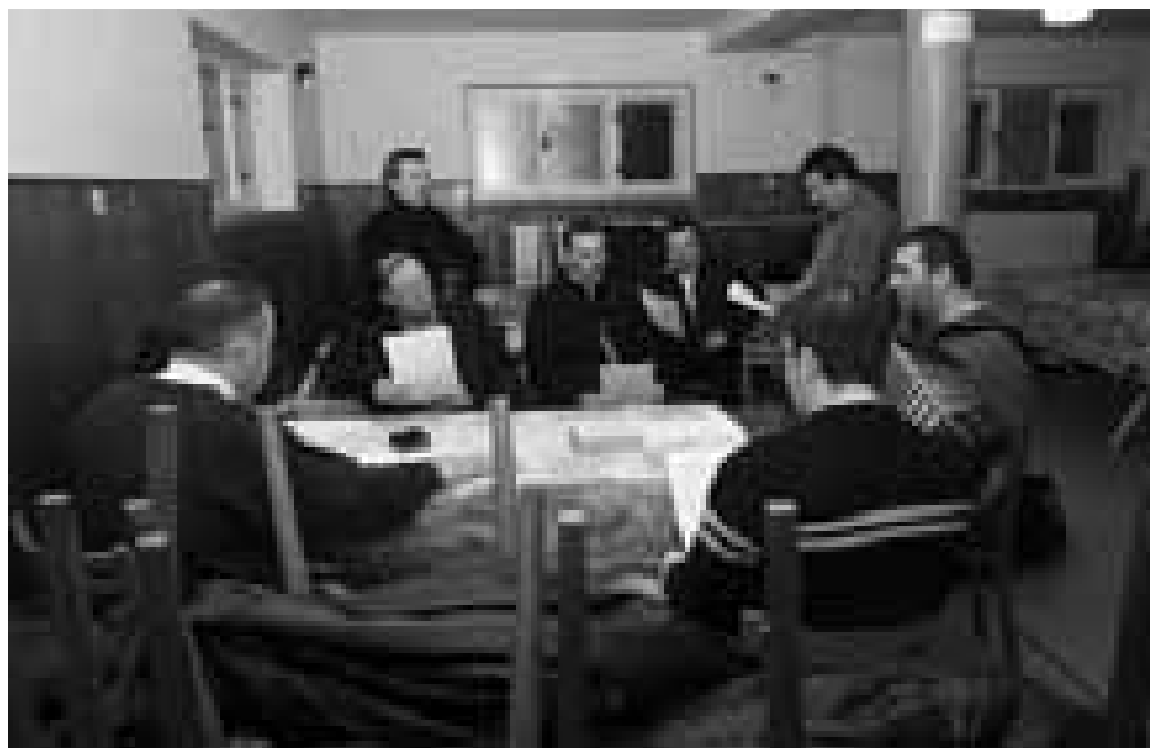
Chtějí oživit vesnici. Ale potřebují, aby jich bylo víc.

Texty jsou vytištěné a okopírované, muži sedí kolem stolu a opět