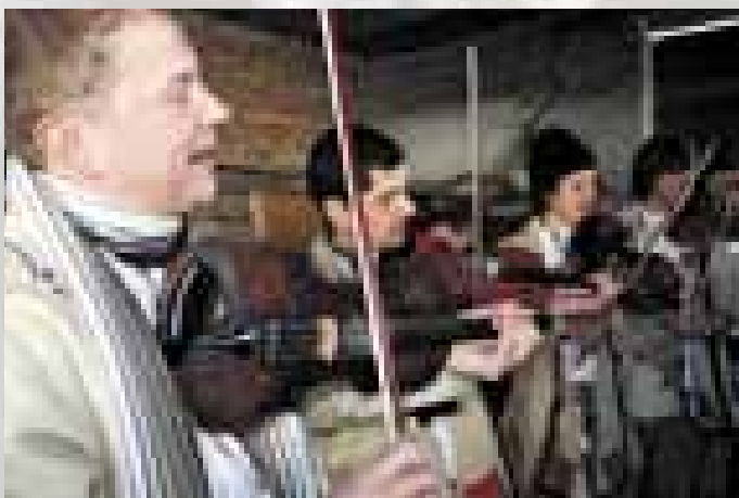
Velká nad Veličkou