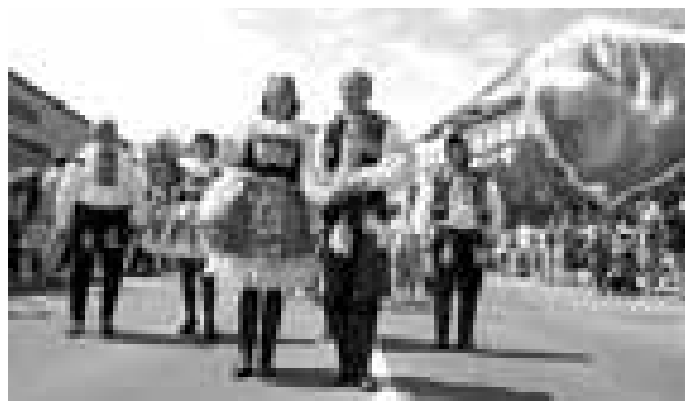
Dolňácké slavnosti 2005.