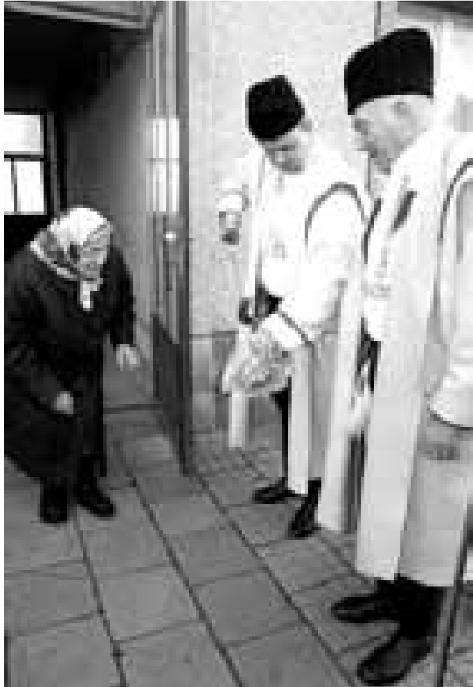
Hluk. Vztah starších lidí k tradicím je tady obdivuhodný.

Všechno to veselí a vzpomínání tradic by ale tady s největší pravděpodobností nebylo, pokud by Ostrožská Nová Ves neslavila letos výročí. „Hlavním impulsem pro vznik fašanku bylo to, že slavíme 750 let od první zmínky o naší obci,“ potvrzuje starosta. „Co bude dál, uvidíme, pokud by