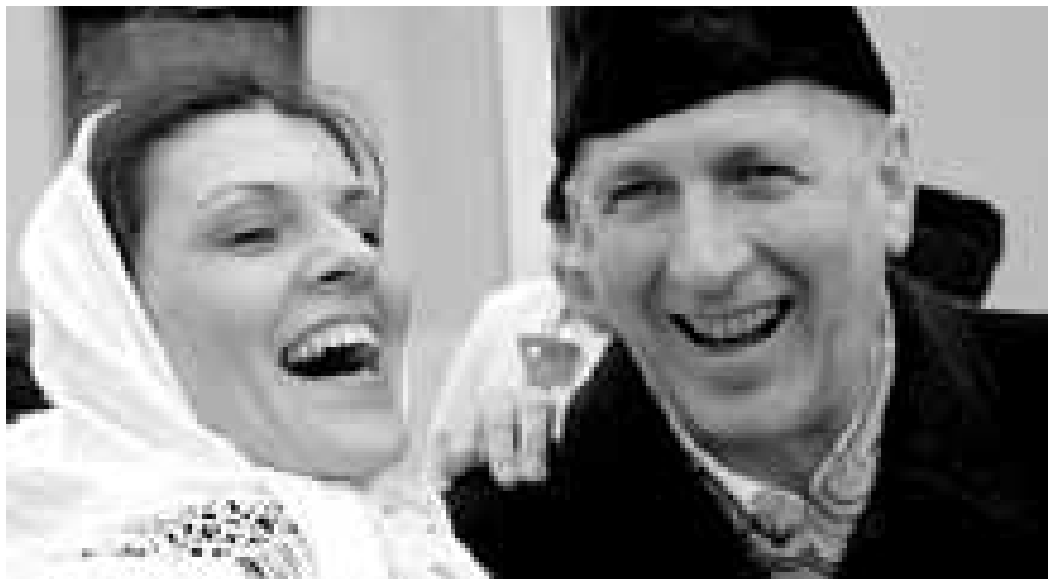
Ostrožská Nová Ves. O fašank se „postaral“ po letech starosta (na snímku). Obec totiž slaví kulaté výročí svého vzniku.

Když vyjedete za fašankem na Horňácko, najdete tady určitou podobu právě s Hlukem. Maškary chybí, podstatná je