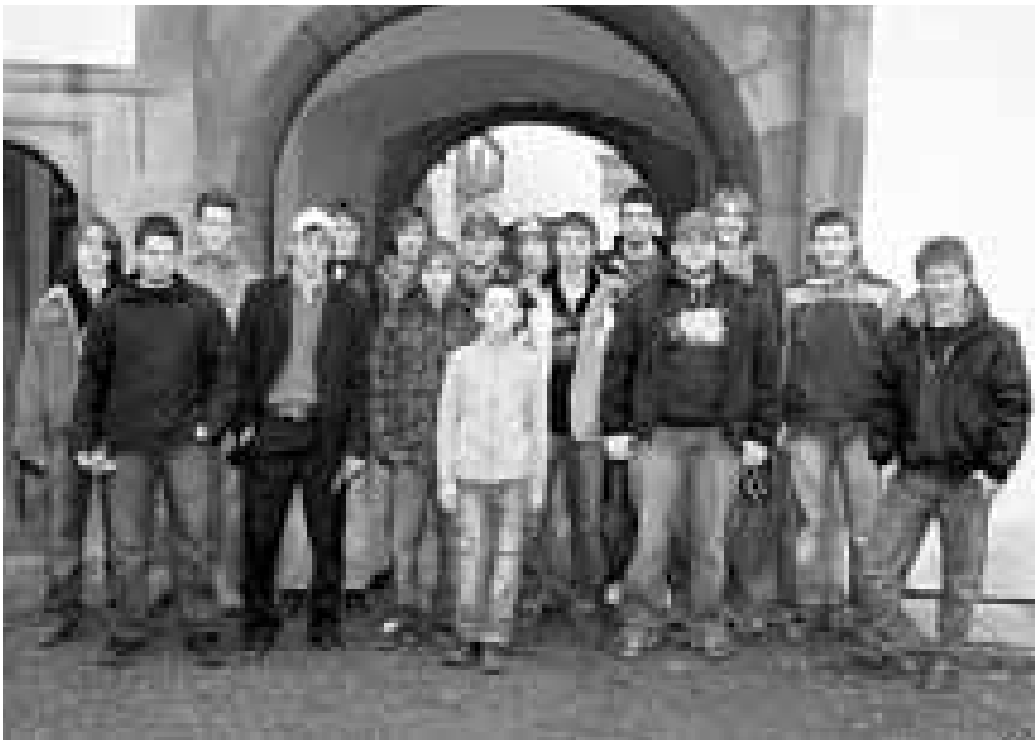
Oni mají nést dávnou tradici dál. Král je ten nejmladší a nejmenší uprostřed.

Hlučtí kluci mají svou jízdu teprve před sebou, záleží na nich, co „provedou“ s tradicí svých otců a dědů. „Hýlom, hálom!“