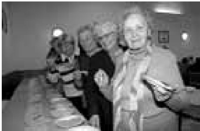
Mladí by nám mohli závidět, jak se umíme bavit.