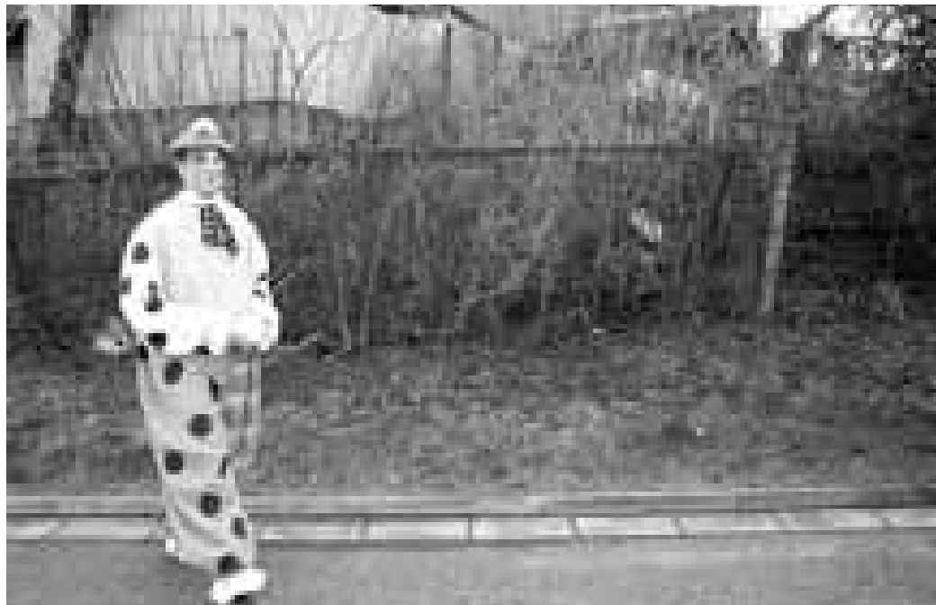
Ostrožská Nová Ves

Ve sklepích pod vinohrady už stojí v sychravém počasí několik desítek lidí, které evidentně