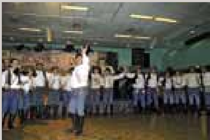
Hornácký mužský sbor z Velké nad Veličkou