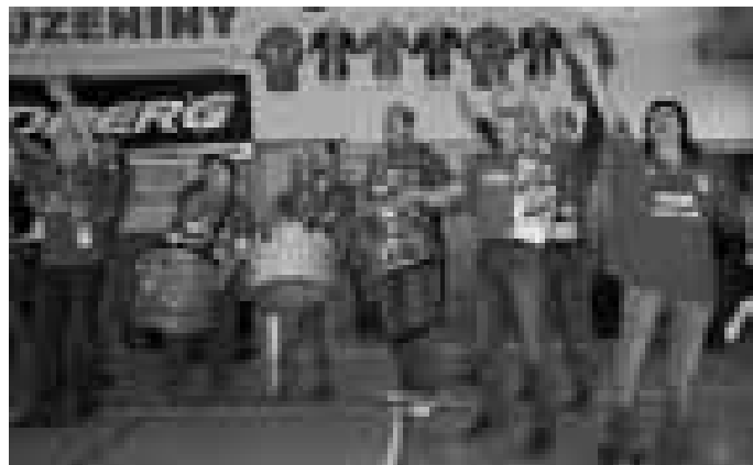
Své hráčky povzbuzují za každé situace. To je věrný fanclub veselských házenkářek.

tak, vy myslíte Aťu,“ vystřelil bezprostředně ze sebe tato žena