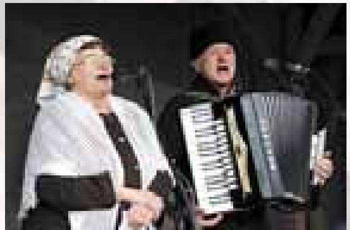
Veselí nad Moravou