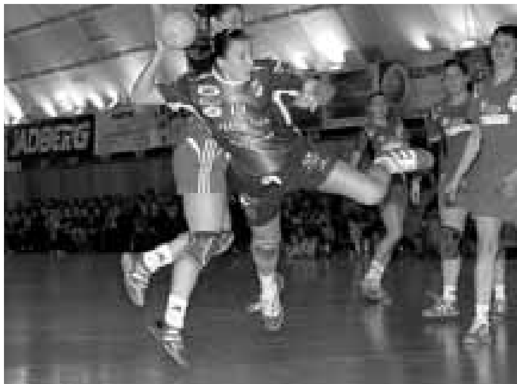
Házená je atraktivní podiváná, plná zajímavých sportovních okamžiků. Zájem sponzorů je přesto malý a hráčky musí mít často druhé zaměstnání.

Pokud ale chcete dělat kterýkoliv sport na vrcholové úrovni, potřebujete k tomu peníze. A to byl na chudším Slovácku prob-