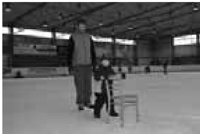
Začátky jsou těžké.

„V současné době, je zimák využitý zhruba na devadesát procent, ovšem v atraktivních podvečerních a večerních časech. V jinou dobu, zejména dopolední je využitý méně, proto bychom chtěli na led přilákat za pomoci různých grantů a nadací okolní školy. Projekt by měl prostě dostat na náš led pravidelně děti z okolních měst a vesnic. Každá škola by tady mohla mít každý týden svůj pravidelný čas. Také si