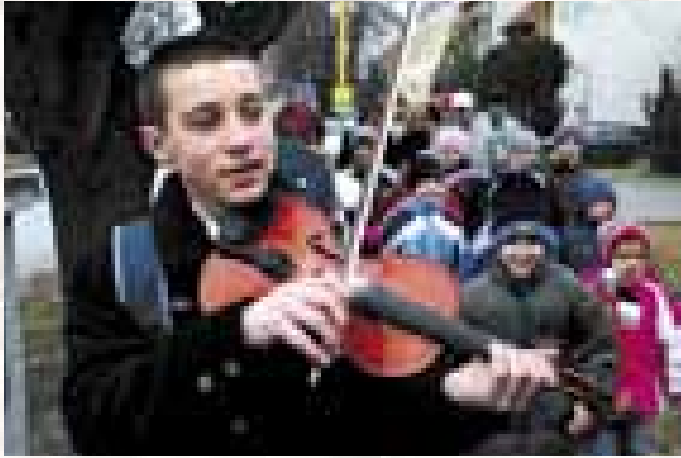
Blatnice pod Sv. Antonínkem