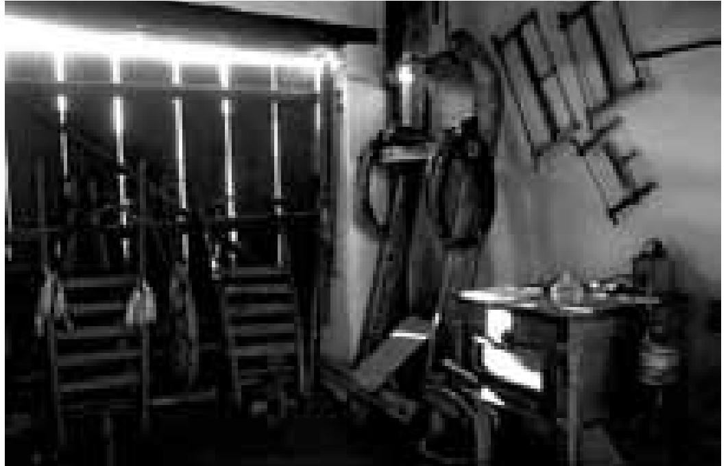
V jednoduchosti je krása.