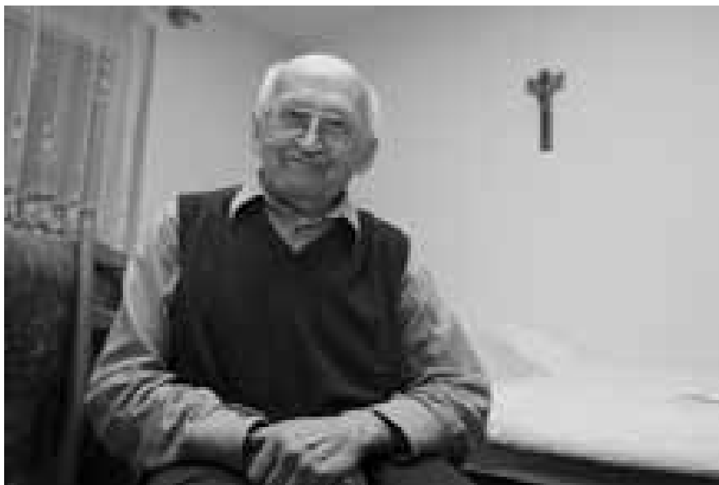
Nejhorší chvíle v životě zažil, když utíkal z Československa.

Svůj nynější domov našel v Domě s pečovatelskou službou v Dolním Němčí. Pokud by si někdo myslel, že zde především odpočívá a zahálí, hodně by se pletl. Přestože nemoc ohnula jeho páteř téměř do pravého úhlu a bolest ho omezuje v pohybu, duševně je stále velmi svěží.