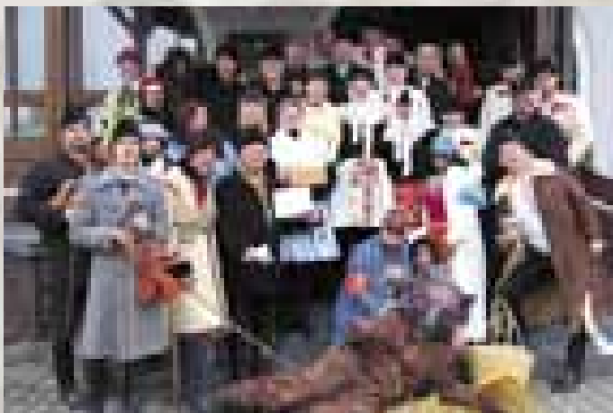
Ostrožská Nová Ves