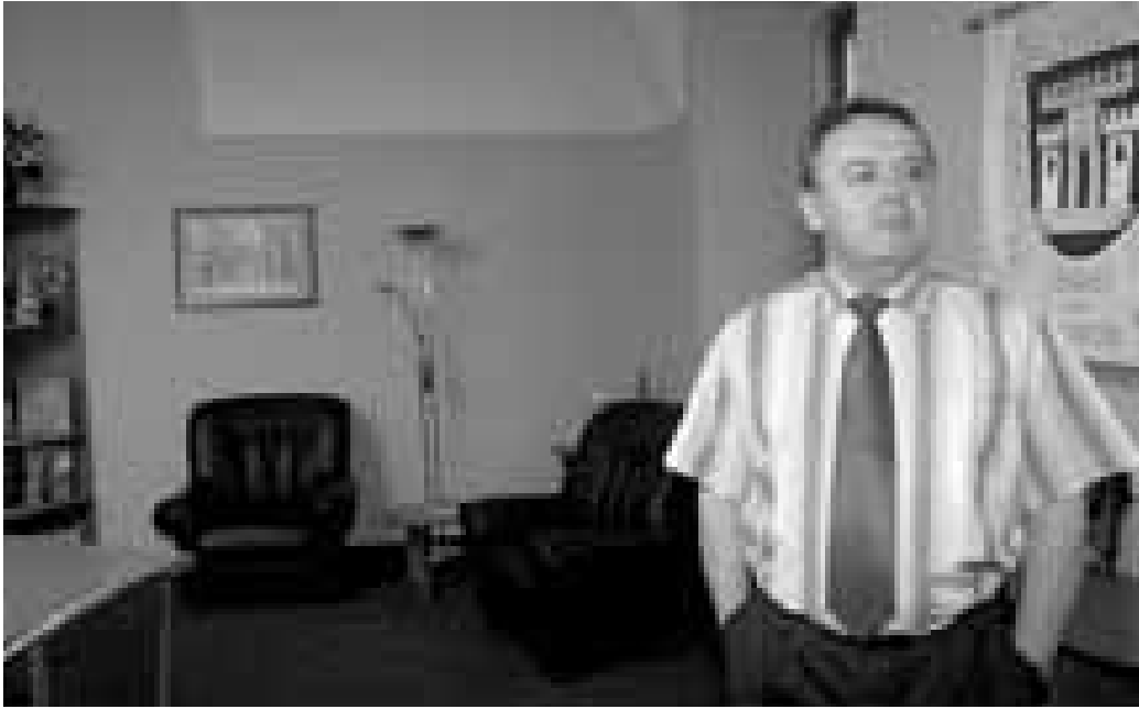
„Rád bych ve vedení města pokračoval.“